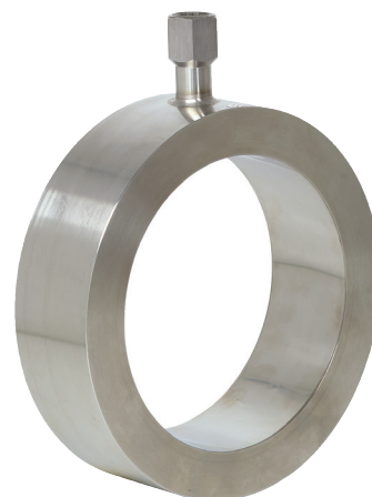
Трубные мембранные разделители, ячейечный тип (сэндвич), модель 981.10