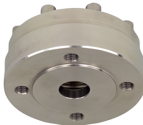
Мембранный разделитель с фланцевым присоединением, модель 990.41

Более подробную техническую информацию о мембранных разделителях и системах с мембранными разделителями можно увидеть в типовом листе 00.06 «Применение, принцип действия, конструкции».