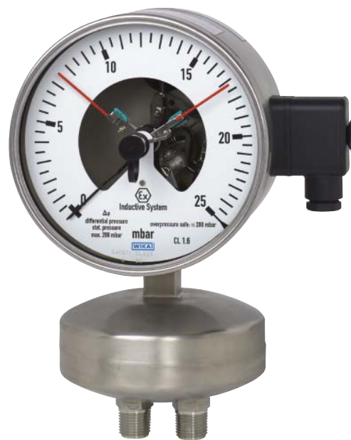
Дифференциальный манометр 736.51

от 0 ... 2,5 до 0 ... 160 мбар, а также другие эквивалентные мановакуумметрические и вакуумметрические диапазоны