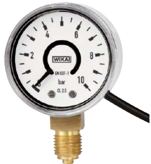
Деформационный манометр switchGAUGE PGS07