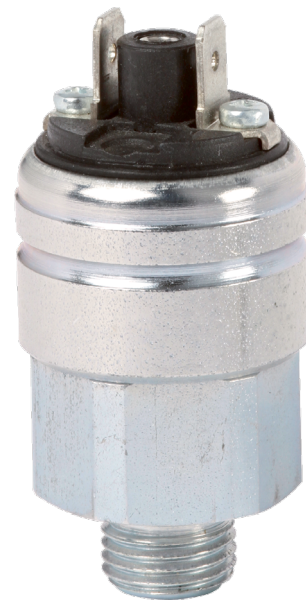
Компактное реле давления, стандартное исполнение, модель PSM06